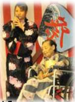
入居者様による “おめかししまショー”