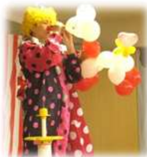
ボランティア 様“バルンアート”