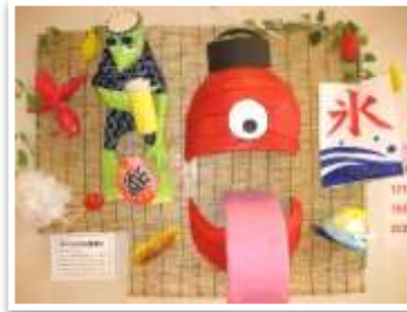
D:『オバケたちの夏休み』