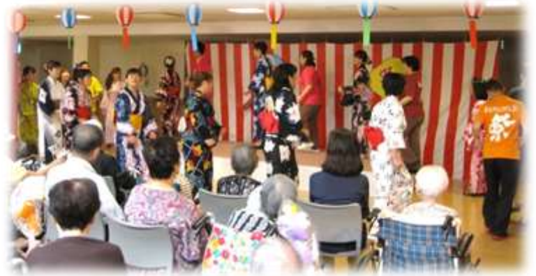
スタッフによる“炭坑節”