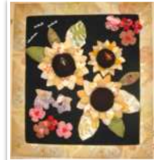
B:『ヒマワリへの想いが強すぎて』