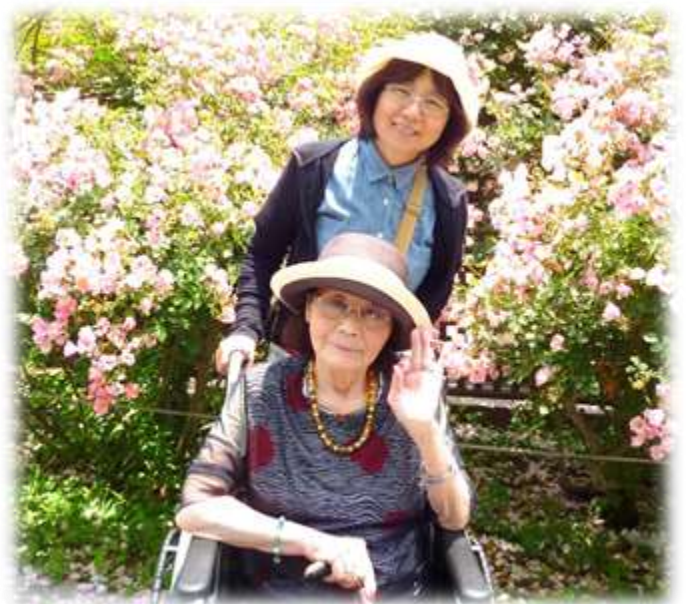
グリーンパークにて