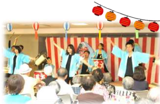
ひびき信用金庫 様 “五平太ばやし”