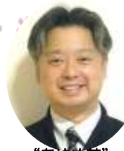
“あやめ苑” 上野施設長

花乃路は、3月に8年目を迎え上野副施設長が、“あやめ苑”施設長として異動となりました。 4月には新社会人となったスタッフが4名入職、スタッフのユニット異動もあり新体制となりました