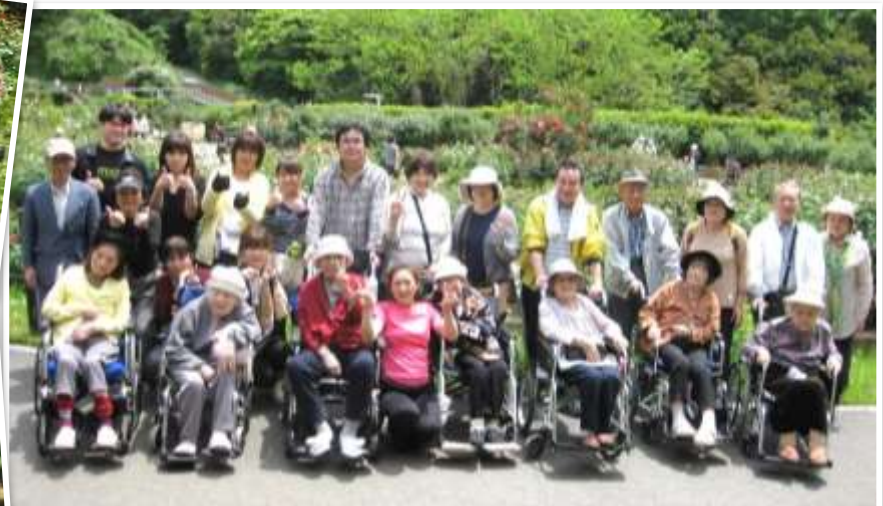
Dブロック 5月 ご家族様と一緒にグリーンパークへ