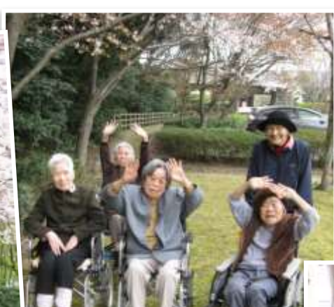
Eブロック 4月 お花見へ